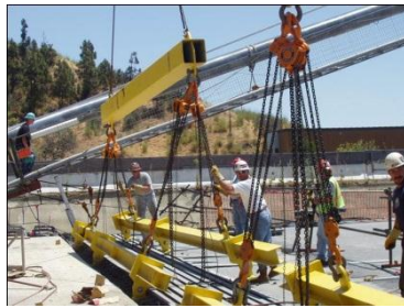
工業安全吊鉤應用實例

個人工作安全的五金配件組合，主要的產品類型如繩扣、鋼筋掛鉤、D 型吊環、帶扣、調整裝置、抓繩器，鋼、鋁鉤環等。主要的應用方向如電信及電力公司的高空架設人員的安全防護設備，或者是建築工地的建築工人在高空作業時的安全防護設備。