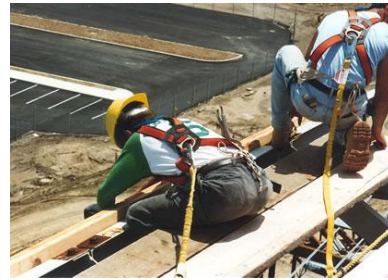
個人防墜器應用實例